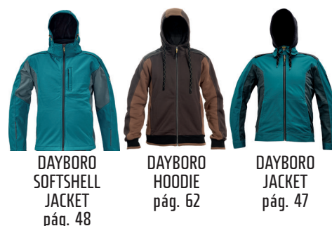
DAYBORO SOFTSHELL JACKET pág. 48